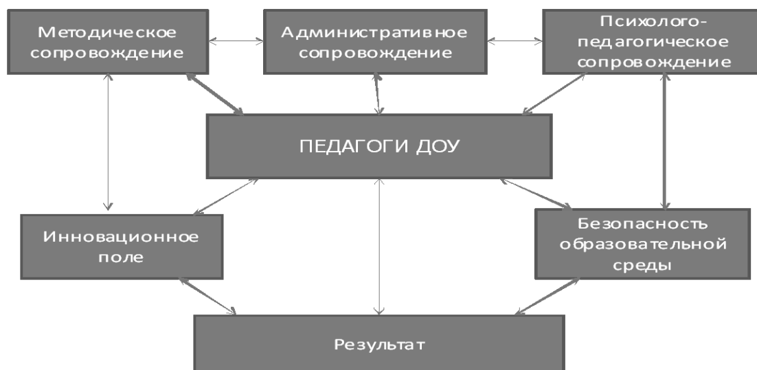
Рисунок. Модель тьюторского сопровождения педагогов МБДОУ №155 г.